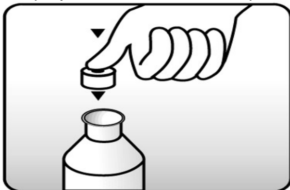
Fig. 1: coloque a tampa com orifício (batoque) no frasco.