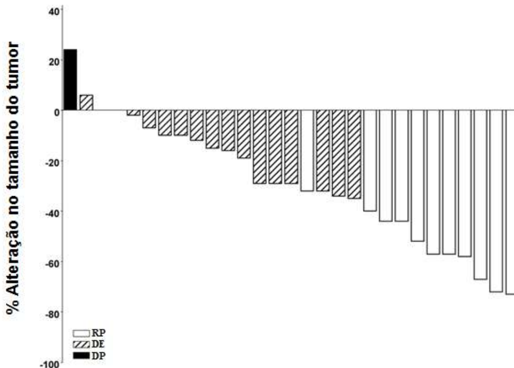
Figura 1 Coorte CBC Metastático

Nota: O tamanho do tumor é baseado na soma dos maiores diâmetros das lesões alvo. DP = doença progressiva, DE = doença estável, RP = resposta parcial. Três pacientes apresentaram uma melhor alteração percentual em tamanho tumoral de 0; estes são representados por barras positivas mínimas na figura. Quatro pacientes foram excluídos da figura: 3 três pacientes com doença estável foram avaliados apenas por lesões não-alvo e 1 paciente não foi passível de avaliação.