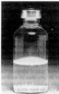
Fig. 1 - Não use este medicamento se o material permanecer no fundo do frasco após a agitação.

Verificar sempre o frasco de insulina antes de usar. Se você notar qualquer diferença na aparência ou alterações marcantes nas características da insulina, consulte o médico.