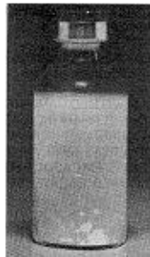
Fig. 2 - Não use este medicamento se houver grumos em suspensão (soltos) no líquido após a agitação.