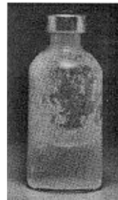
Fig. 3 - Não use este medicamento se partículas no fundo ou na parede derem ao frasco um aspecto fosco (embaçado).

Uso de seringa adequada: as doses de insulina são medidas em unidades . O número de unidades em cada mililitro (mL) está claramente impresso na embalagem. Cada tipo de insulina está disponível na concentração de 100 unidades/mL. É importante entender as graduações na seringa porque o volume a ser injetado depende da concentração, que é o número de unidades por mL. Por esta razão, deve-se utilizar sempre uma seringa graduada para a concentração de insulina. Erro no uso da seringa pode levar a um erro na dose, causando sérios problemas, como variação na glicemia (taxa de glicose no sangue) que pode ser muito baixa ou muito alta.