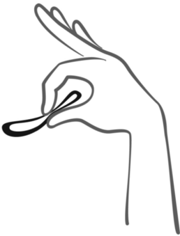
Figuras 3: escolha uma posição confortável para inserir o anel